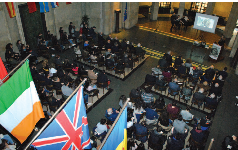
L'Auditorium della Casa Madre dei Mutilati (Piazza Adriana - Roma)