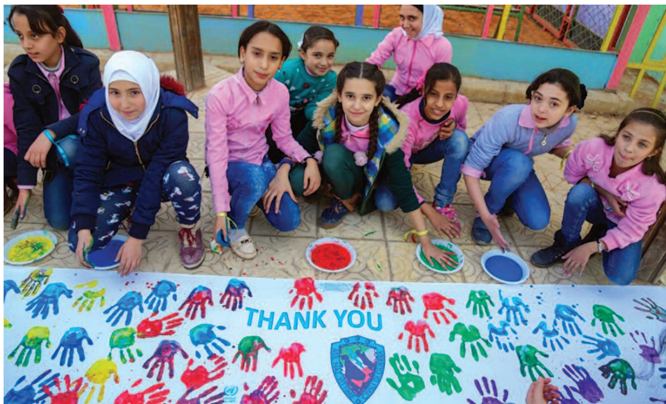
Scuola di Al-Zahria, campo rifugiati di Neirab, Aleppo, Siria

della musica e dello sport, hanno offerto ai bambini un ambiente sicuro e protetto, dove potersi esprimere in modo creativo e affrontare paure e ansie con il supporto e la guida di personale specializzato e preparato.