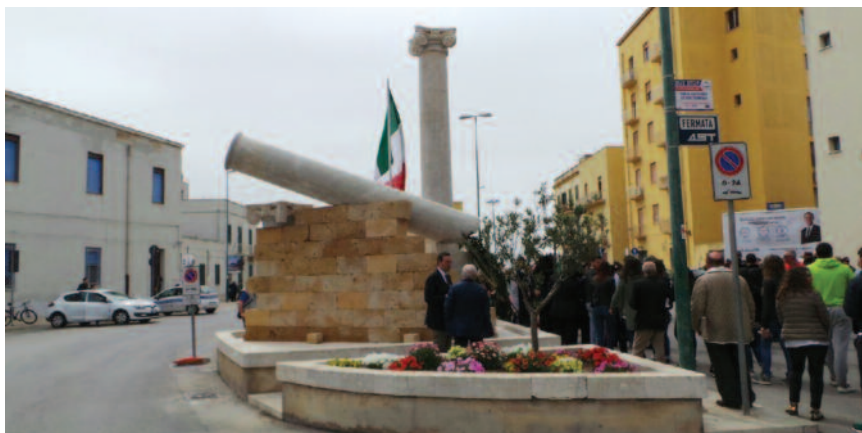
Il monumento dedicato alle vittime civili della seconda guerra mondiale a Trapani