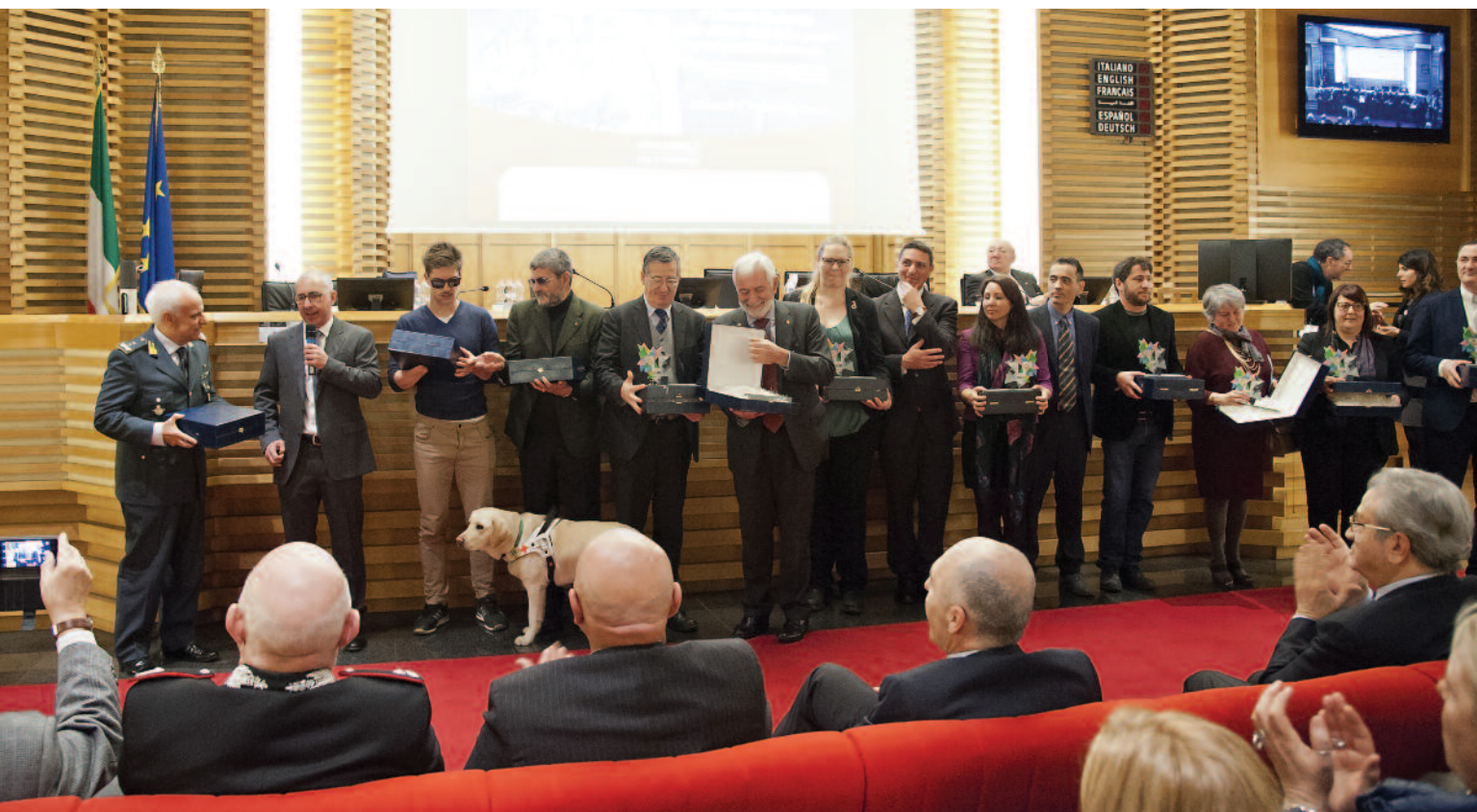
I relatori e la giuria del concorso "La vita è un capolavoro, la guerra un folle salto nel buio" premiati al termine della giornata

nel 2013, a soli 16 anni, per l'esplosione di un ordigno bellico in Val di Susa, da tanti anni vicino all'ANVCG e alle sue battaglie. Nel suo discorso, seguito dai presenti con particolare partecipazione, ha ricordato l'incidente di cui è stato vittima, portandolo come esempio paradigmatico della permanenza nel lungo periodo degli effetti devastanti delle guerre per la popolazione civile. Rivolgendosi in particolare agli studenti presenti nella sala, ha invitato tutti quanti a farsi parte attiva per evitare che in futuro altri ragazzi e ragazze possano avere il suo stesso sfortunato destino, in ogni parte del mondo.