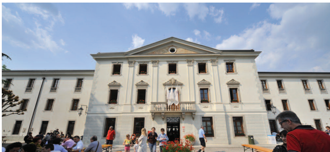
Villa di Toppo Florio, sede del Collegio di Buttrio

privati di gambe, mani, occhi, ha conficcato schegge nella loro carne e negli organi vitali.