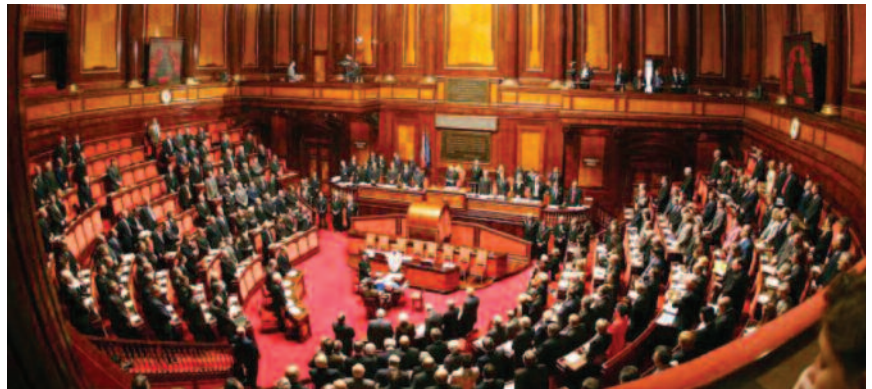
Il Parlamento in Seduta Comune

Seppure meritevole nelle intenzioni, la modesta entità di questo fondo non consente però al momento di