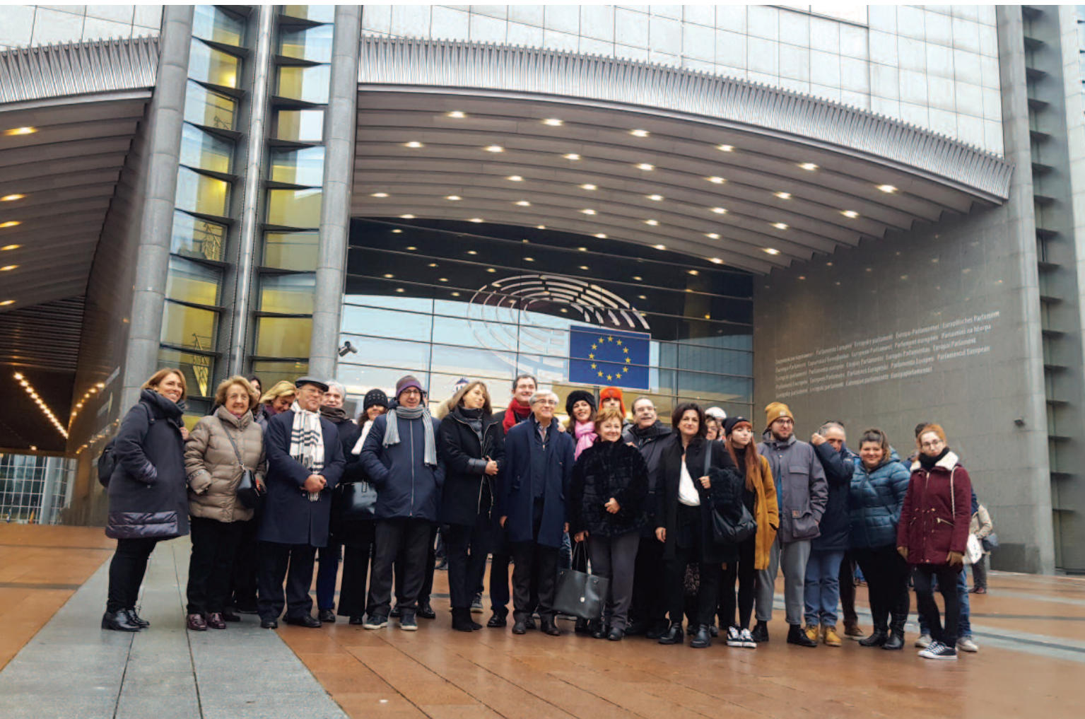
La delegazione (composta da ANVCG, CMAS e studenti) fuori dal Parlamento di Bruxelles

tanti giovani di vivere autentiche esperienze di integrazione attraverso la valorizzazione e la riscoperta dell'immenso patrimonio naturalistico ed archeologico presente nel Mediterraneo. Questo mare, così ricco di tesori nascosti, ma anche teatro di terribili naufragi, è per eccellenza anche un luogo di incontro, di frontiera e di pace. Ripartire da qui vuol dire necessariamente mettere al centro i nostri valori, abbattere i muri della diffidenza e promuovere reali forme di integrazione.