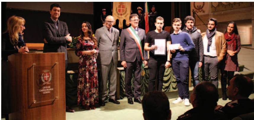
Gli studenti premiati dal Sindaco e dalla rappresentanza dell'ANVCG

“ P erché la guerra è il nostro nemico auspico un mondo di pace”. Questo il titolo e l’argomento del concorso lanciato dalla Sezione di Treviso dell’Associazione Nazionale Vittime Civili di Guerra ONLUS, dedicato alle Scuole Primarie e Secondarie di I° e II° grado del Mandamento di Castelfranco Veneto.