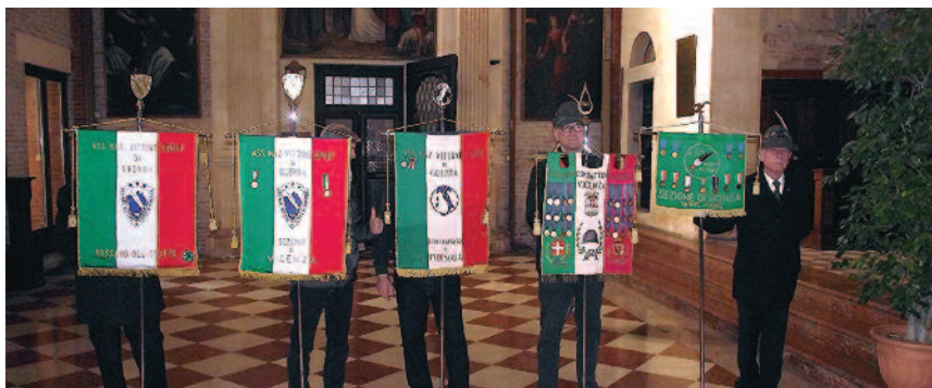
La delegazione dell'ANVCG durante l'anniversario

E' la più grande tragedia che tocchi Vicenza e la sua popolazione. Non sono certo i danni materiali a fiaccare questa volta i cittadini, ma la strage di civili innocenti sconvolge i sentimenti di tutti.