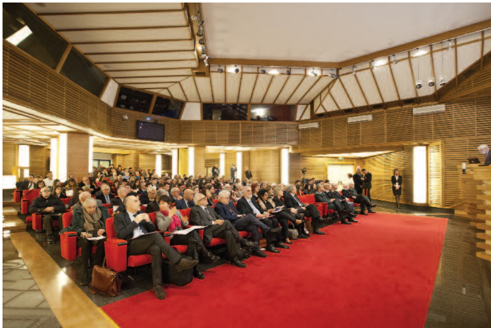
L'auditorium durante la conferenza stampa

sociazionismo nel nostro paese e non solo. In particolare è stata presentata la campagna “Stop bombing towns and cities”, lanciata qualche anno fa dalla rete International Network on Explosive Weapons (INEW) e che l'ANVCG sta promuovendo in Italia con lo slogan “Stop alle bombe sui civili”.