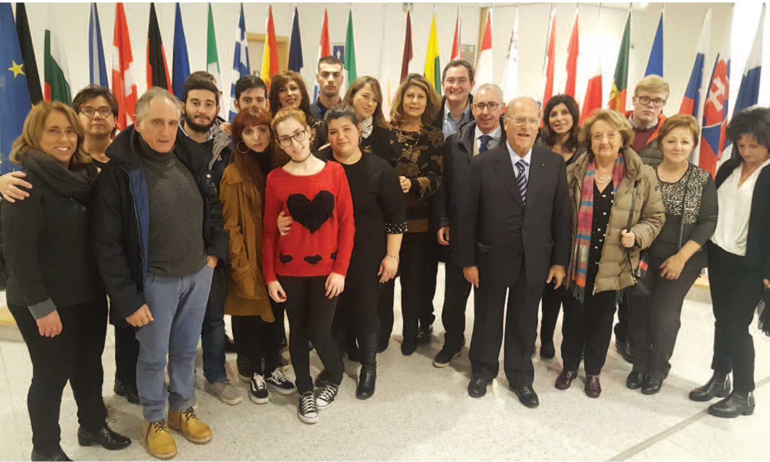
La delegazione nelle sale del Parlamento di Bruxelles