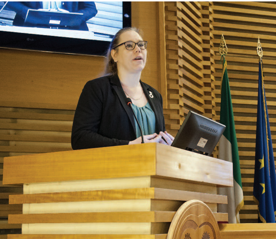
Susanne Snyder di ICAN (Premio Nobel per la Pace 2017) durante il suo intervento

nata l'adesione alla campagna contro i bombardamenti sulle aree densamente popolate. La mobilitazione della società civile può portare a grandi risultati, come ha dimostrato l'esempio della campagna di ICAN per l'abolizione delle armi nucleari. Siamo convinti che questi sforzi possono portare ad un mondo migliore, soprattutto per le generazioni che verranno».