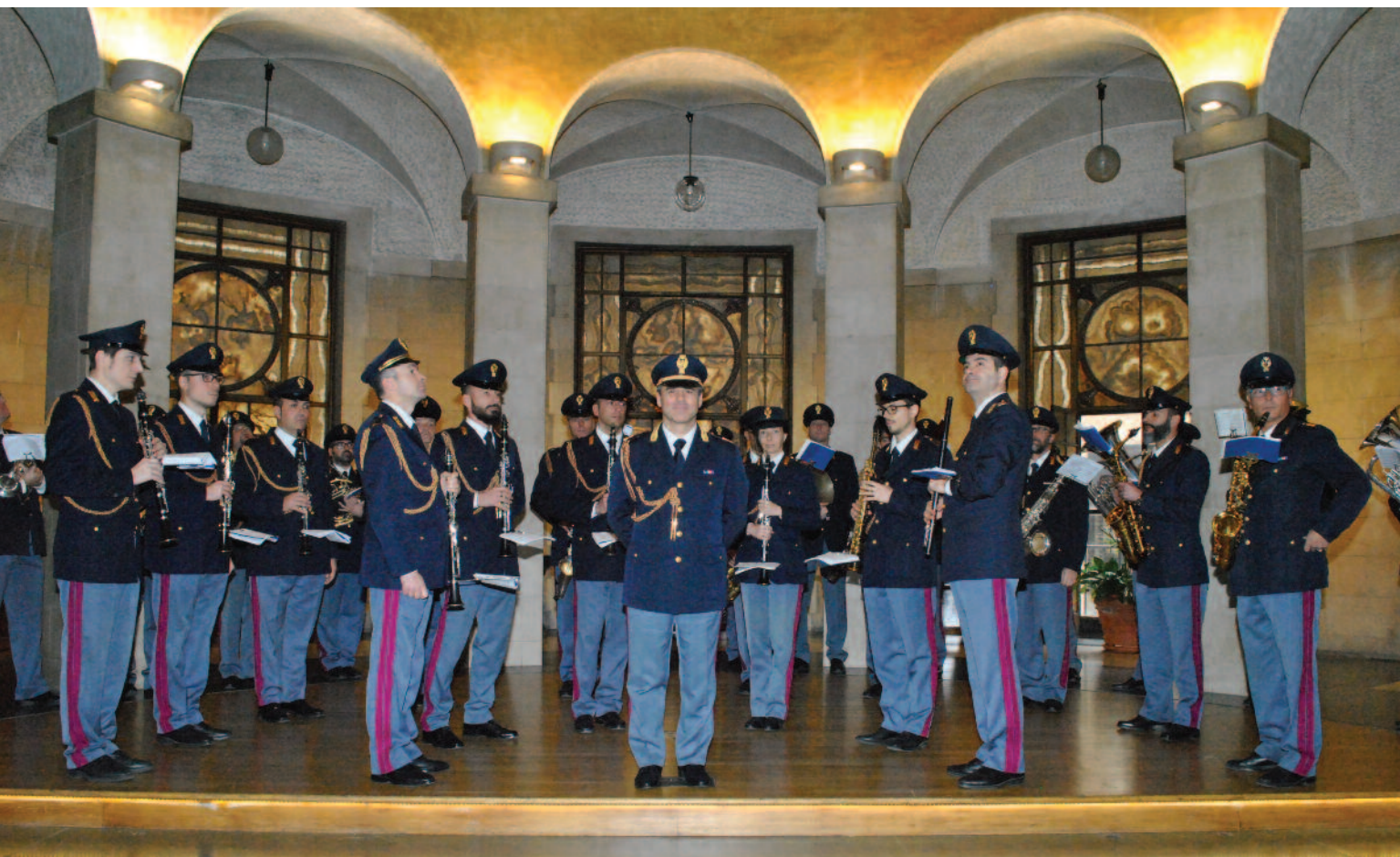
La Fanfara della Polizia di Stato