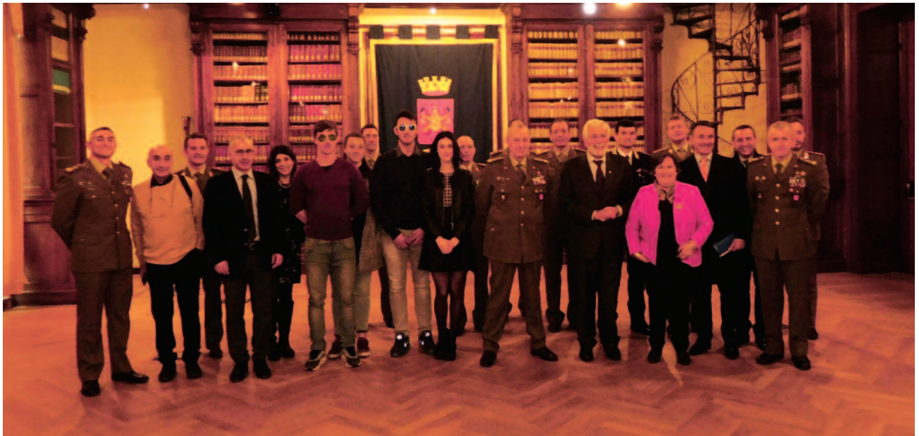
La delegazione dell'ANVCG con quella dell'Esercito e la Sen. Teresa Armato

stato concluso un protocollo d'intesa con il MIUR per portare la campagna di sensibilizzazione nelle scuole in maniera capillare. L'Esercito Italiano, grazie ai propri team di specialisti di pronto intervento, è in grado di intervenire 24 ore su 24 su tutto il territorio nazionale. Negli ultimi 10 anni hanno condotto oltre 35.000 interventi di bonifica del territorio. I reparti del Genio, grazie alle esperienze maturate nelle missioni estere e all'elevata connotazione "dual-use" (capacità di cooperare con le autorità civili a favore della cittadinanza e quella più operativa espressa fuori area), agiscono a favore della comunità nazionale sia in caso di pubbliche calamità, sia per la bonifica dei residuati bellici ancora ampiamente presenti sul territorio italiano.