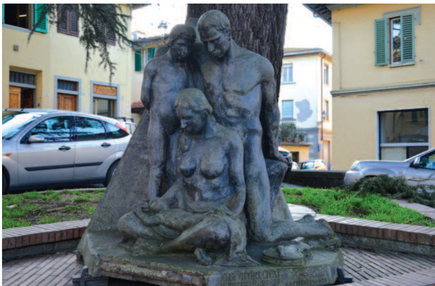
Il monumento ai caduti di piazza del Poggio

E ad un tratto quel rumore in cielo, e gli aerei, tanti, ma chi si