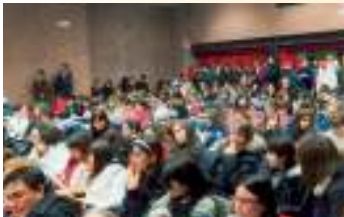
Il tavolo della Presidenza e la sala gremita di studenti in occasione della "Giornata della Pace e della Solidarietà".