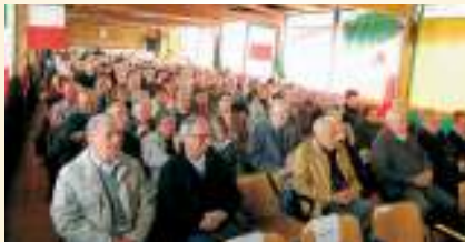
La sala gremita dell'Assemblea di Ravenna.

I temi trattati: bene comune, immigrazione, sicurezza.