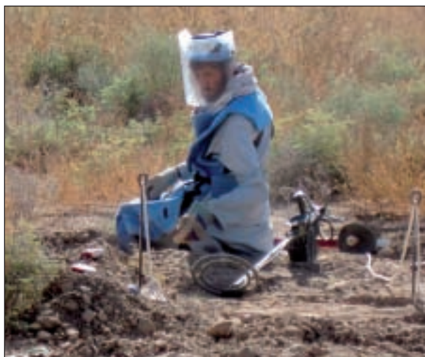
Operazione di sminamento