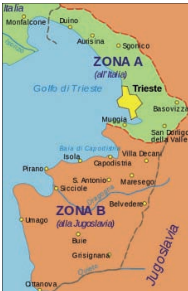
La questione territoriale dell'Italia nord-orientale affrontata col trattato di Osimo

italiani l'iniziativa e l'intraprendenza, specie nei ceti abbienti".