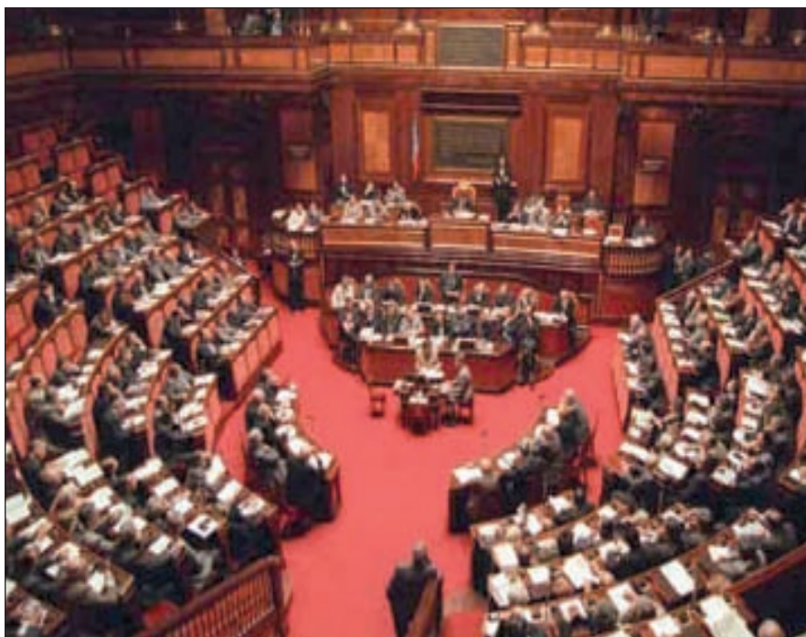
Aula del Senato

Fino a pochi mesi fa, la possibilità di tassare le pensioni di guerra era qualcosa che si poneva al di fuori dei principi del nostro ordinamento e contro tutta la storia