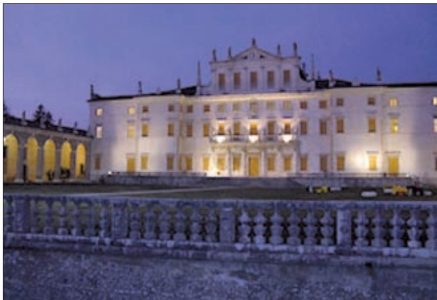
La villa in cui Napoleone firmò il trattato di Campoformio

che si ripete ogni anno il 10 febbraio (per non dimenticare le vittime delle carneficine del comunismo titino) – il confine orientale viene associato alla tragedia delle foibe e ai lager del maresciallo Tito pseudo-liberatore.