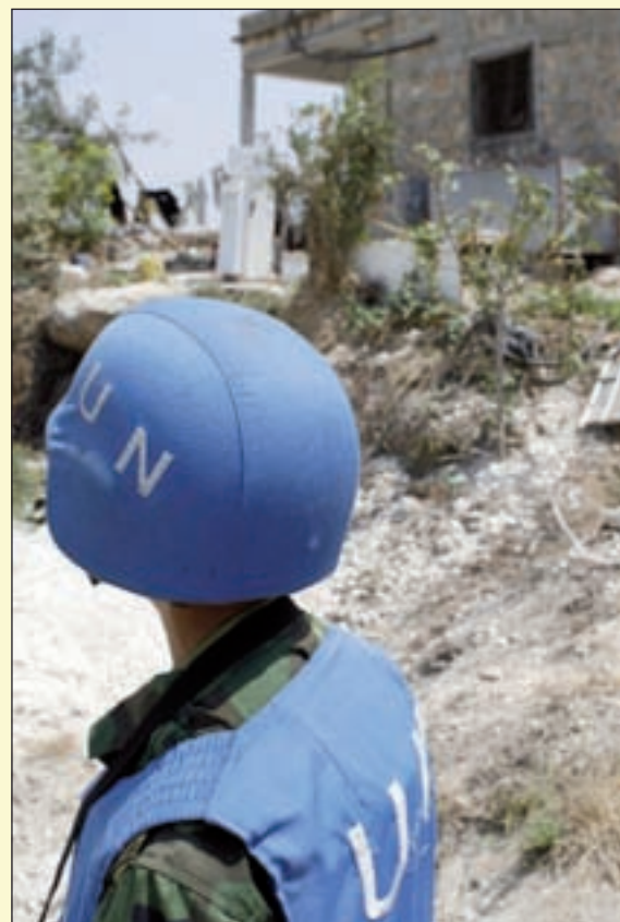
Un casco blu controlla una zona libanese con bombe a grappolo inesplose

Sino ad oggi sono almeno 62 gli Stati nel mondo che hanno aderito alla convenzione contro le bombe a grappolo. Il fine è quello di ottenere un mondo libero da questo tipo di munizioni. Inoltre "dobbiamo rispondere – ha spiegato Duarte – ai pericoli costituiti dalle