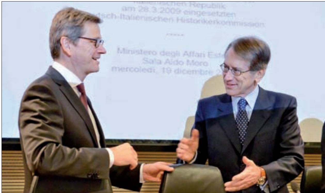
Da sinistra il Ministro tedesco Westerwelle e il Ministro italiano Terzi (Roma, 19 dicembre 2012)

costituito da storici italiani e tedeschi, con il mandato di un approfondimento comune sul passato di guerra delle due nazioni e, in particolare, sugli internati militari italiani, come contributo alla costruzione di una comune cultura della memoria.