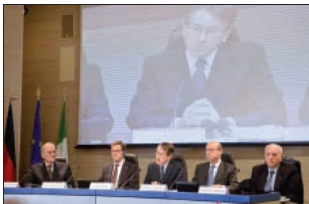
Presentazione alla Farnesina del Rapporto della Commissione degli storici italo-tedeschi (Roma, 19 dicembre 2012)

gli oltre 600.000 internati militari italiani deportati in Germania dopo l'8 settembre 1943, il cui triste destino collettivo è stato, fino ad oggi, ampiamente dimenticato.