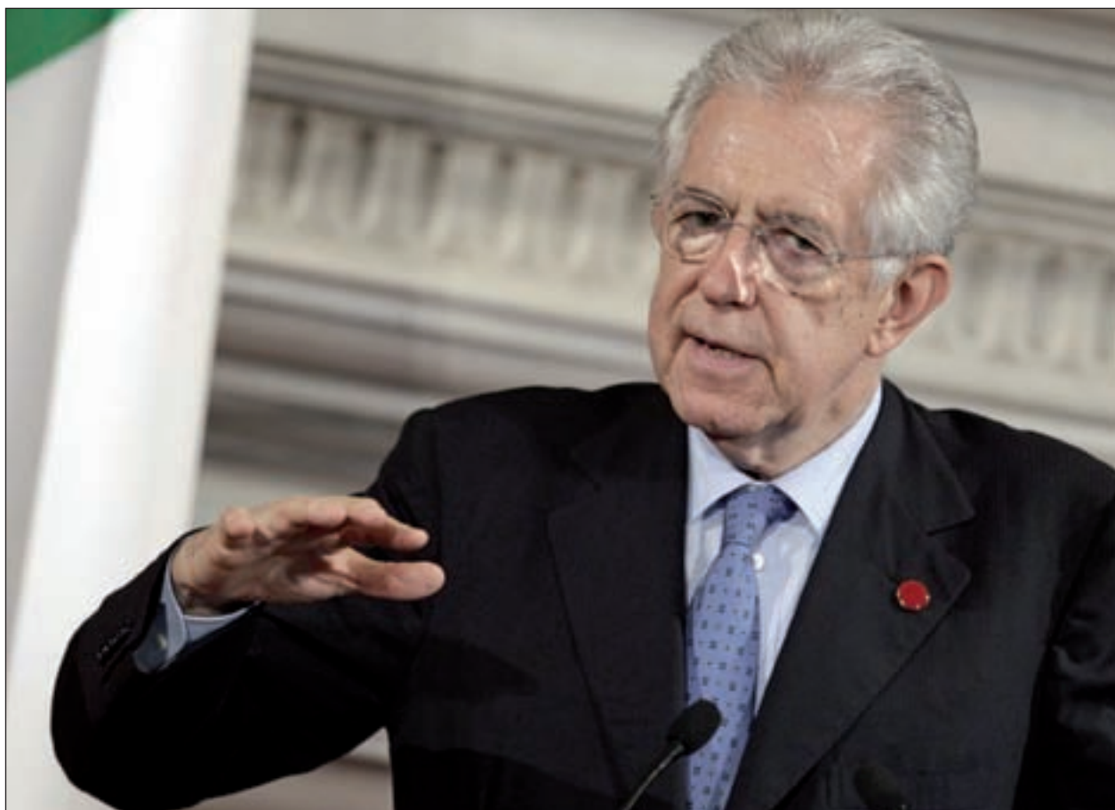
Il Prof. Mario Monti

del nostro paese, tanto da essere un'eventualità assolutamente impensabile. I fatti di questo autunno hanno, invece, dimostrato il contrario e stupisce ancora di più che un simile "scivolone giuridico" sia stato commesso da un Governo "tecnico". Non meno perplessità desta la resistenza che il Governo ha dimostrato prima di cedere alla cancellazione della norma, trincerandosi dietro problemi di copertura degli oneri finanziari basati su calcoli assolutamente irrealistici. Ben altro era stato il comportamento rispetto la tassazione delle pensioni e assegni di invalidità civile, eliminata dal disegno di legge di stabilità in poche ore, ancora prima che arrivasse all'esame del Parlamento, nono-