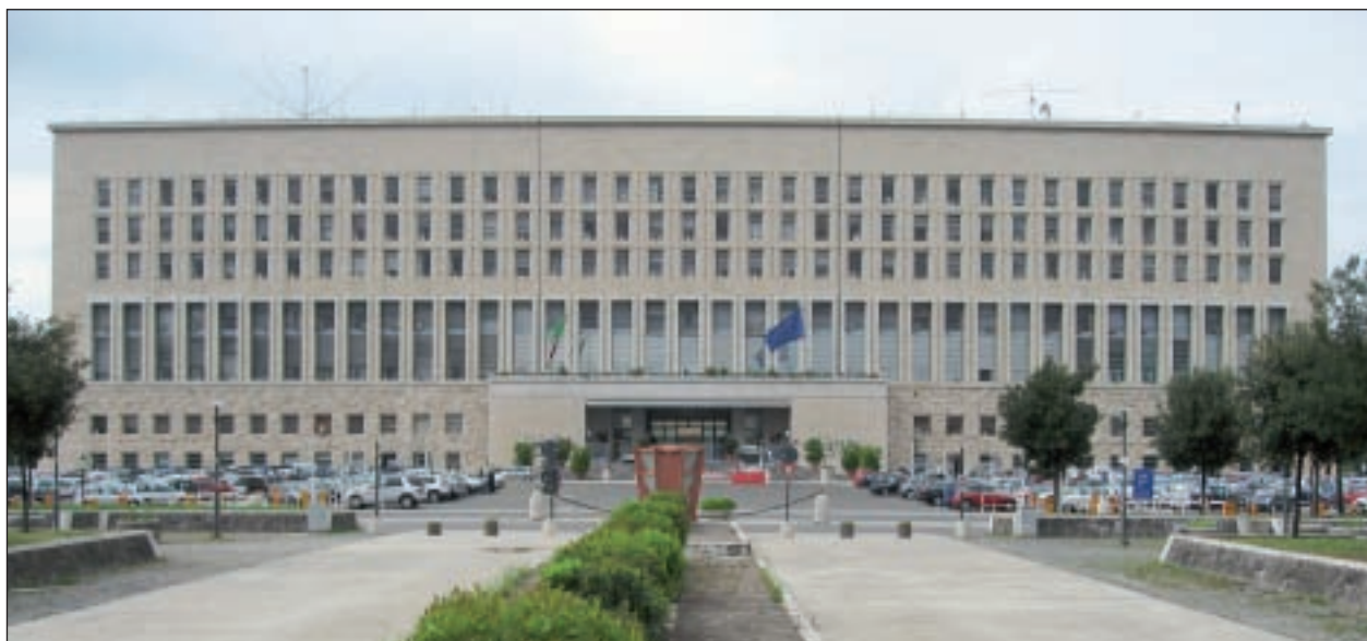
Ministero degli Affari Esteri

I l 19 dicembre 2012 si è tenuta, sotto gli auspici dei Ministri degli Affari Esteri di Germania e Italia, presso la Farnesina, la Conferenza di presentazione del rapporto della Commissione di storici italo-tedesca, costituita nel 2009, per “fornire un approfondimento comune sul passato di guerra italo-tedesco e in particolare sugli internati militari italiani come contributo alla costruzione di una comune cultura della memoria ”.