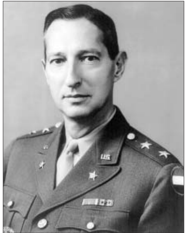
Il Generale americano Mark Clark

La Seconda guerra mondiale fece larghissimo uso di mine, che venivano poste come sbarramento e ostacolo attivo laddove si erano temuti sbarchi o si svolgevano azioni di resistenza, con conseguente stazionamento, più o meno prolungata, da parte delle truppe operanti. Un'eredità mortale, quella lasciata all'Italia dalla guerra, insieme ai disastri delle devastazioni sul territorio. Elevatissimo è infatti il numero dei feriti, dei morti e dei mutilati, senza distinzione di età e di sesso. Conseguenza, questa, anche del fatto che le aree interessate – oltre ad