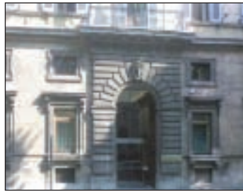
Ministero del lavoro

N ell'interpello n.43/2012, il Ministero del Lavoro ha chiarito alcuni aspetti riguardanti la concessione del congedo straordinario per l'assistenza al familiare disabile, in presenza del coniuge di quest'ultimo. In particolare è stato chiarito che la sola età avanzata del coniuge non le-