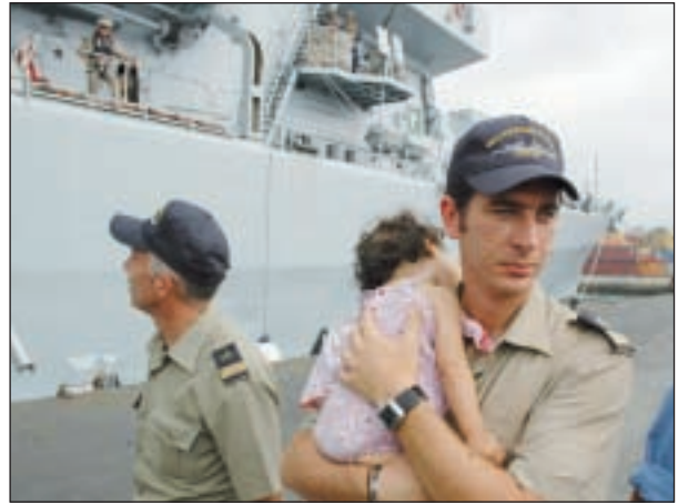
Evacuazione della popolazione civile in Libano

A patire i danni maggiori, accanto ai militari, è infatti proprio la popolazione civile, e