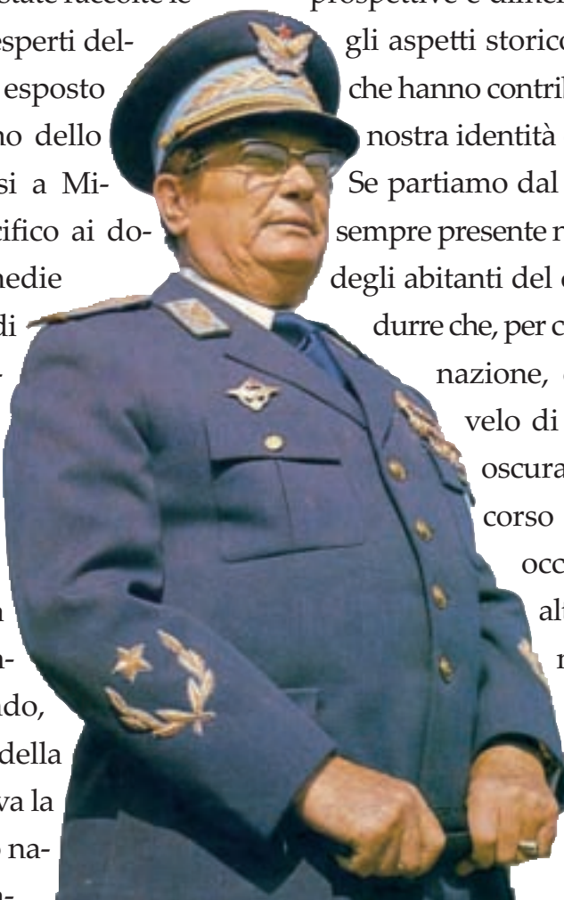
Josip Broz, detto il maresciallo Tito (7 maggio 1892-4 maggio 1980), si macchiò del massacro di migliaia di persone inermi

Nel libro "Italia, confine orientale e foibe", edito da Solfanelli nel 2010, sono state raccolte le relazioni che alcuni esperti dell'argomento hanno esposto durante un convegno dello scorso anno, svoltosi a Milano, rivolto in specifico ai docenti delle scuole medie inferiori e superiori di tutt'Italia. In particolare l'attenzione si è concentrata sulle migliaia di vittime civili, massacrate dal maresciallo Tito, alla fine del secondo conflitto mondiale quando, nella maggior parte della penisola, si festeggiava la liberazione dal giogo nazifascista. È per trasmettere alle future generazioni una storia nazionale autentica,