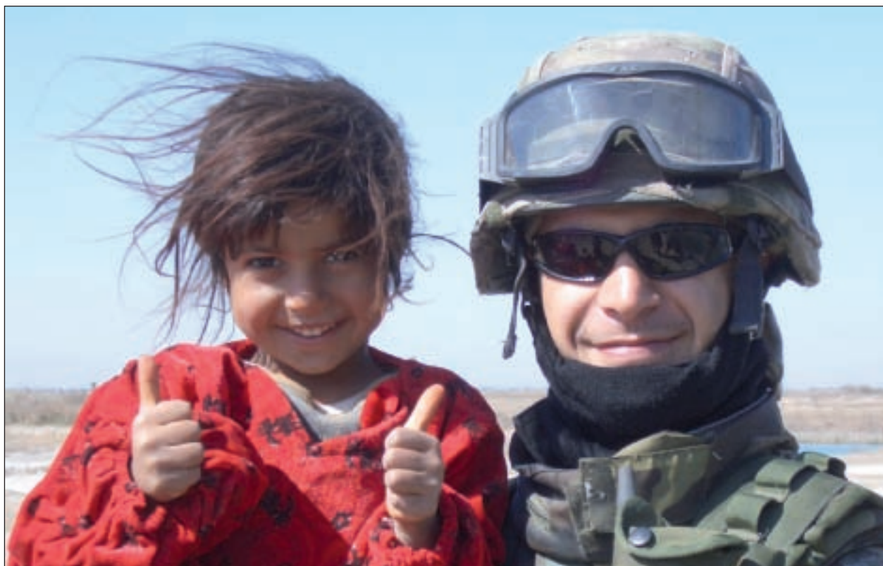
Fuciliere di marina in Iraq

S e il conflitto in Siria fa tentennare gli equilibri internazionali, la crisi economica fa diminuire il numero degli 'uomini in armi' impiegati in missioni di pace all'estero. Dopo aver analizzato la situazione nel Mediterraneo, il Consiglio Su-